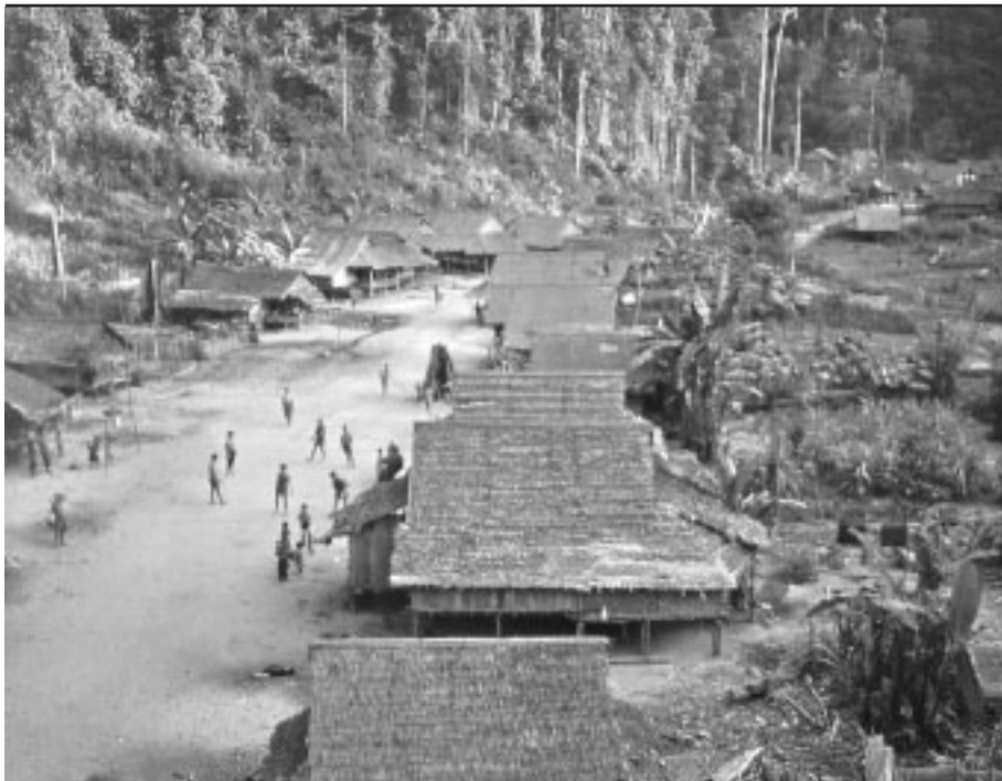
Campo de refugiados de Pa Yaw, provincia de Kanchanaburi, 1994

Los artículos presentados en este número de la Revista sobre Migraciones Forzadas resultan útiles para recordarnos lo que algunos académicos y quienes diseñan políticas han estado argumentando desde hace mucho tiempo: que los “campos” representan una solución pobre para los refugiados.