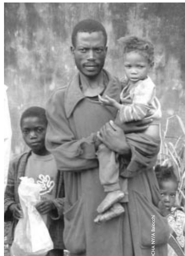
Desplazados internos en el Campo de Camacupa, Angola