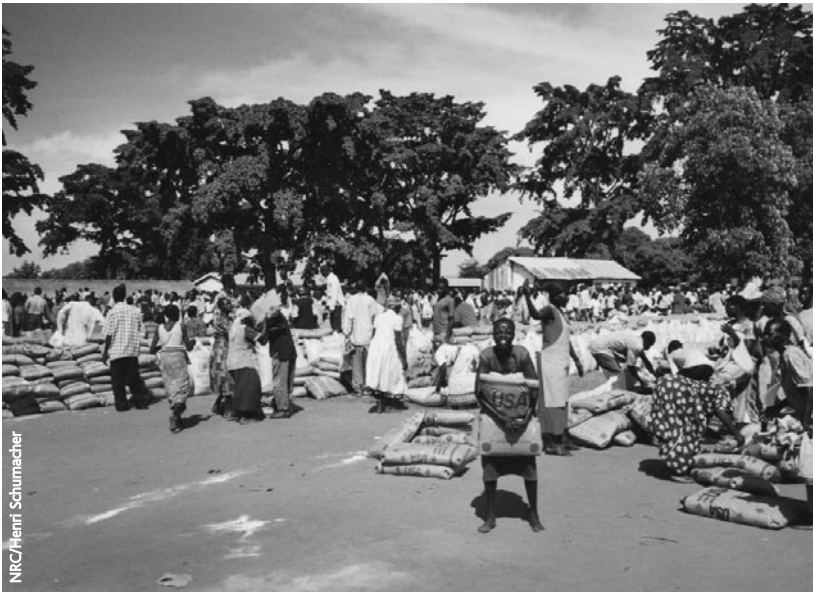
Entrega de alimentos

forma, ellos se involucran en descargar los sacos de los camiones, hacer las raciones y asegurar la distribución ordenada y controlada. Si aún está intacta una estructura social de aldea dentro de los campos, la comida es distribuida entre los líderes tradicionales de la aldea, quienes posteriormente la distribuyen a cada familia. De otro modo, corresponde a las cabezas de hogar, a menudo mujeres, el recibir la ración.