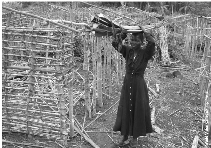
Desplazados internos de Bunia construyen sus nuevas chozas cerca de la aldea Eringeti, provincia de Ituri, RDC